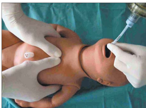
Figura 3. Masaje cardíaco. Técnica de los dos pulgares.