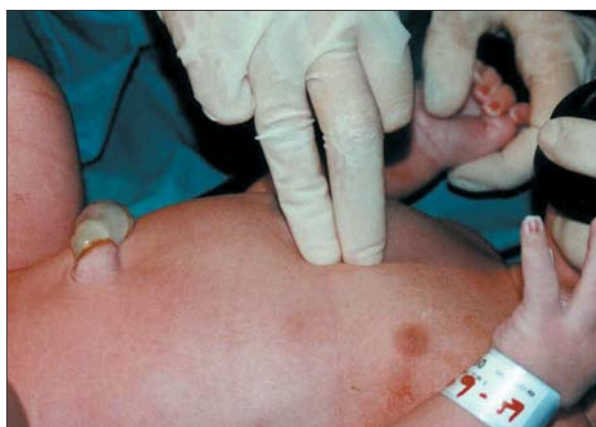
Figura 4. Masaje cardíaco. Técnica de los dos dedos.